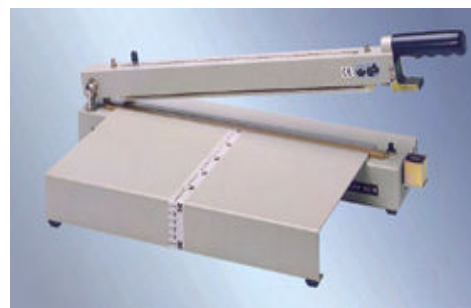
„polystar®“ 423 M SV + AT