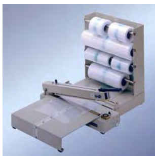
243 M m. SV, Magazin + AT