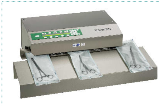
981 DSM tasak felrakó asztallal