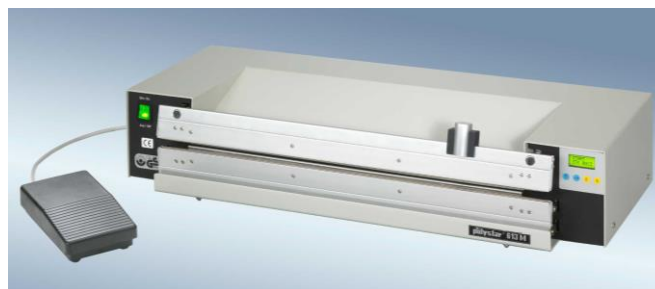
polystar® 613 M vágóegységgel