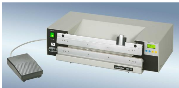
polystar® 413 M vágóegységgel