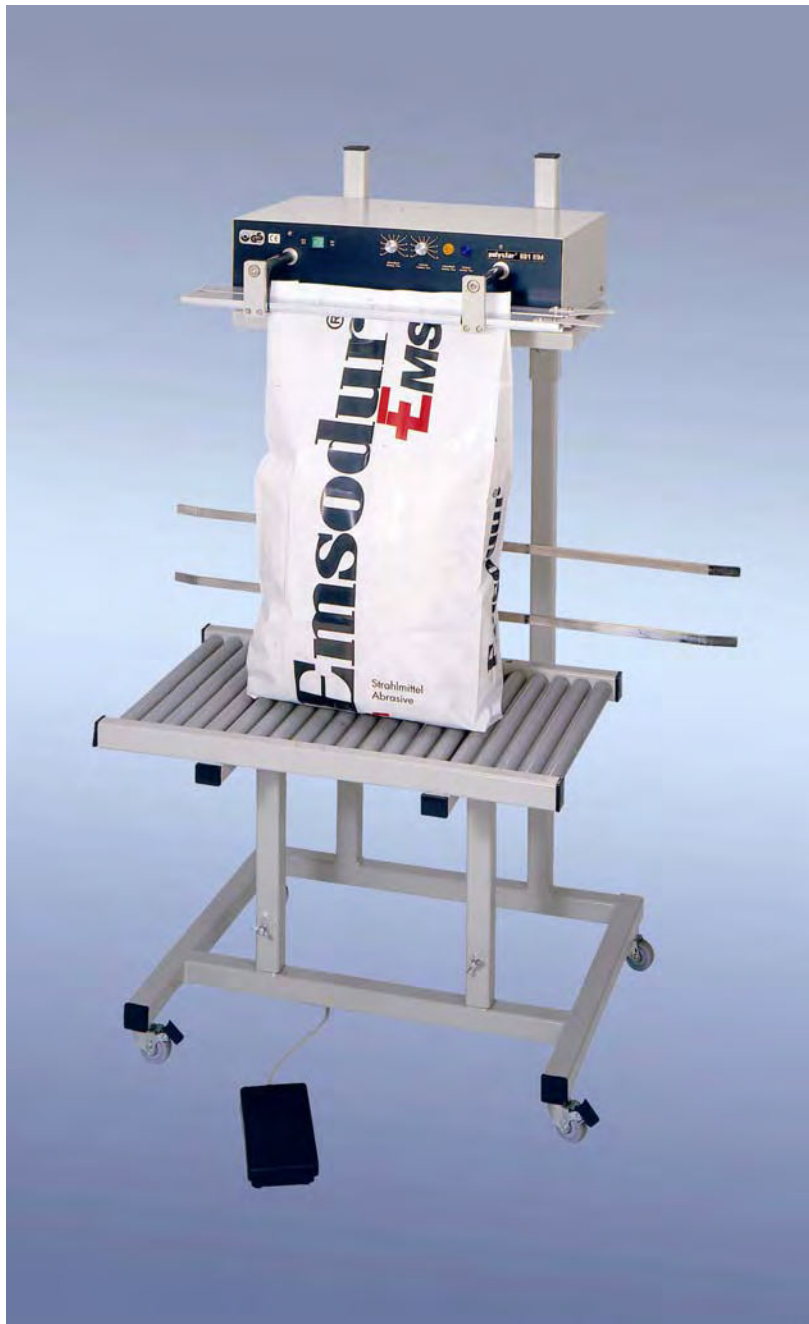
„polystar®“ 601 HM emelhetően, kocsira építve

Mágneses asztali hegesztő készülékek horizontális hegesztősínekkel