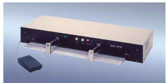
„polystar®“ 801 HM