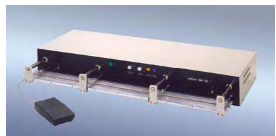
„polystar®“ 1001 HM