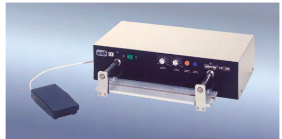
„polystar®“ 401 HM