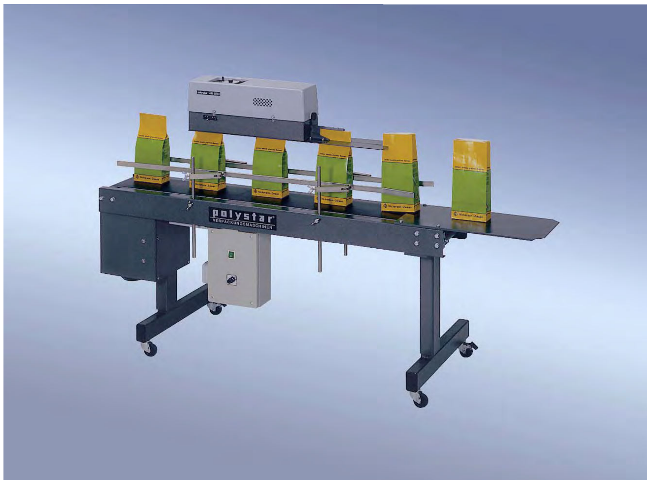
„polystar®“ 400 DSM eltolható szállítószalaggal

Folyamatos fóliahegesztő kombinált fóliákhoz