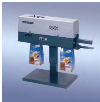
400 DSM asztali állvánnyal