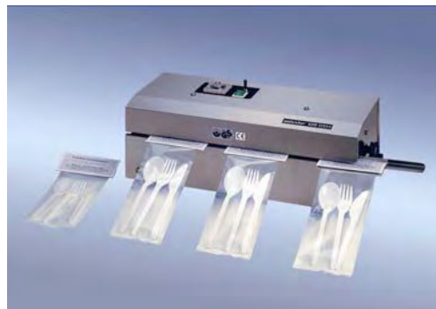
„polystar®“ 620 DSM-HC feltét címkes