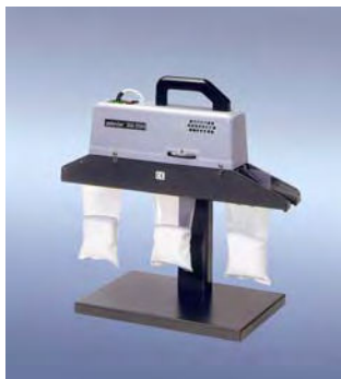
350 DSM-TE zacskó tartóval