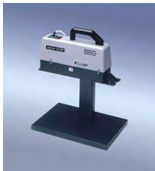
350 DSM (Standard készülék)

„polystar®“ 350 DSM fékezőtű kerek szállítószalagra elhelyezve