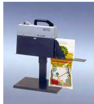
350 DSM-H (különleges kivitel)