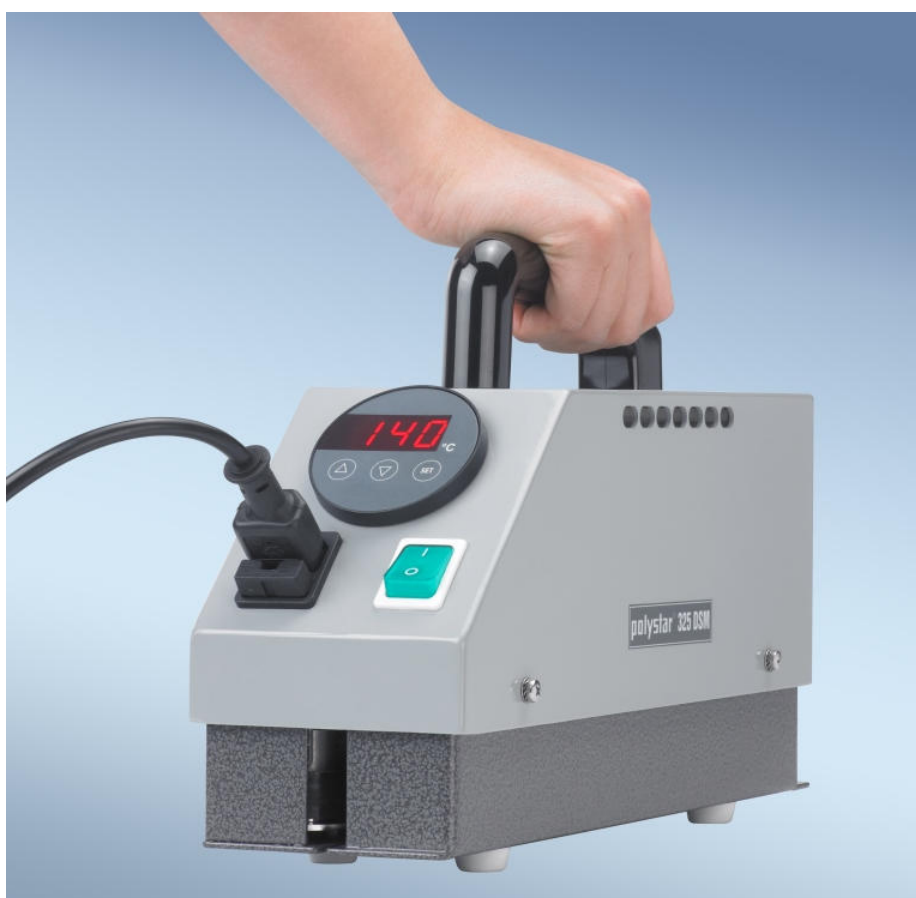
polystar ® 325 DSM

Ezzel a kézi folyamatos hegesztőgéppel nagyméretű polietilén tasakokat és zsákokat hegeszthet egyszerűen és gyorsan!