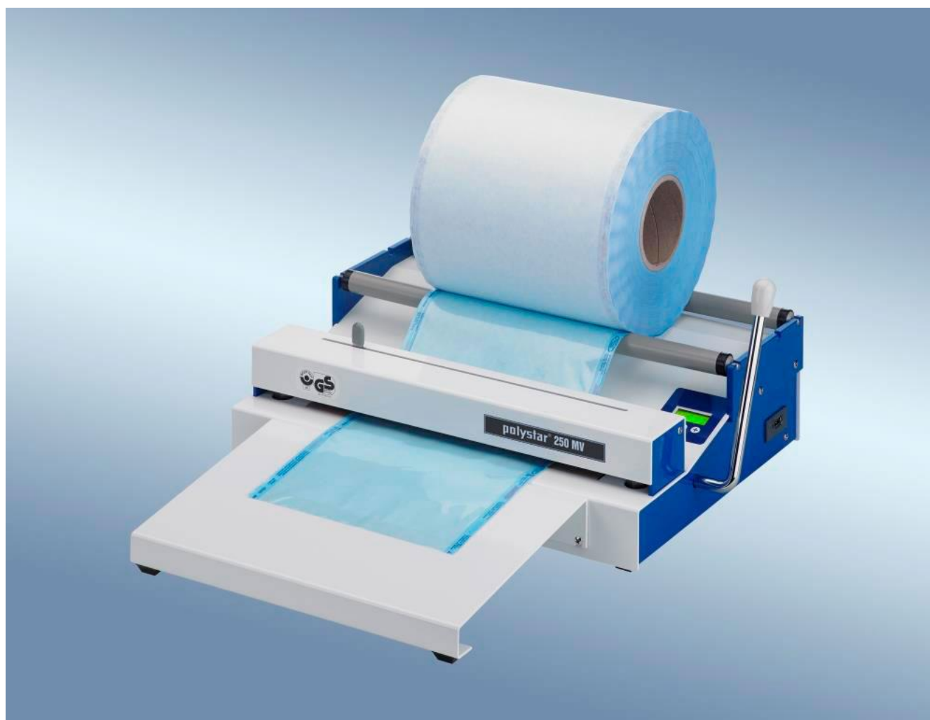
polystar® 250 MV vágópengével, munkaasztallal és fóliagörgő tartóval

Fóliahegesztő berendezés orvosi rendelőkbe