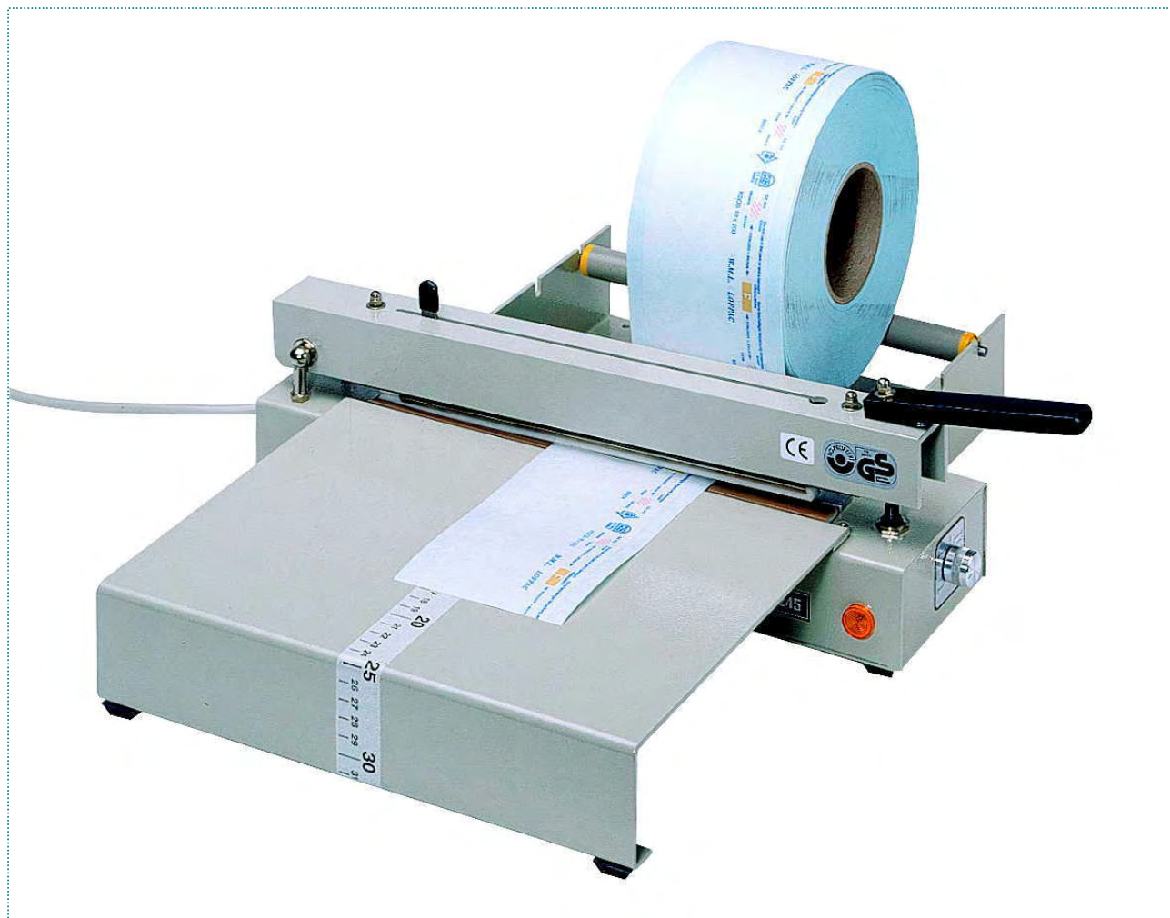
„polystar®“ 245, fóliavágó pengével, munkaasztallal és fóliagörgő tartóval