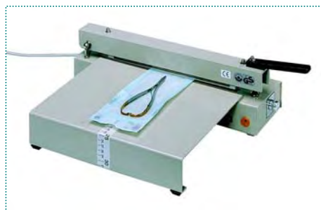
„polystar®“ 244 munkaasztallal